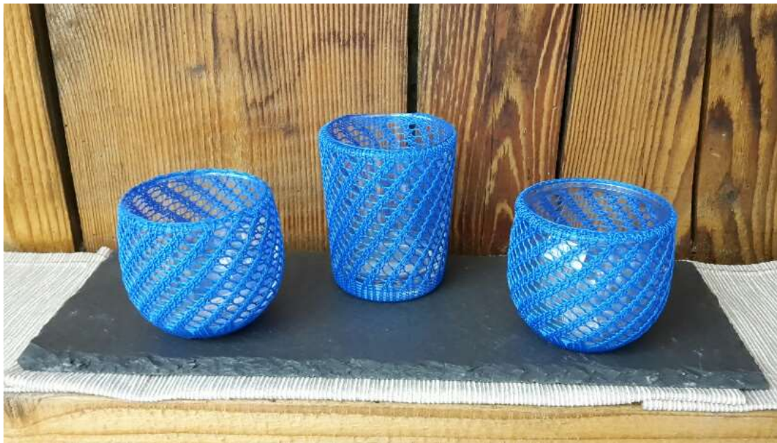
Wind- und Teelichter in verschiedenen Farben und Formen